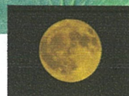
牡鹿月(Buck Moon) 水無月十六日(6/7/21)