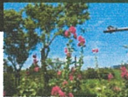
梅雨入り前の tachiaoi 卯月十日(6/6/15)