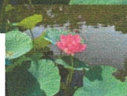
大賀ハス 卯月廿九日(6/7/4)