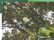
タイサンボク 卯月廿四日(6/6/29)