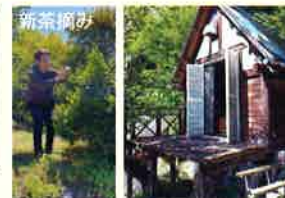
里山くらし体験(安芸太田町津浪)