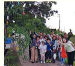
旧暦と暮らす七夕イベント