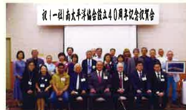
設立40周年記念祝賀会