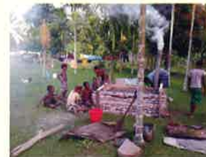
ニューギニア炭焼き実践