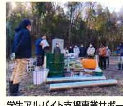
学生アルバイト支援事業サポーター 里山保全・炭焼き指導(神戸)