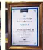
CSOアワード アイデア賞受賞