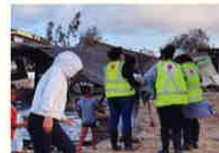
フンガ・トンガ噴火被災義援金募金活動