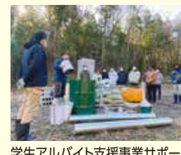
学生アルバイト支援事業サポーター 里山保全・炭焼き指導(神戸)