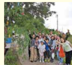
旧暦と暮らす七夕イベント