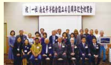
設立40周年記念祝賀会