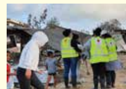
フンガ・トンガ噴火被災義援金募金活動