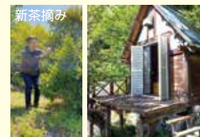
新茶摘み 里山くらし体験(安芸太田町津渡)