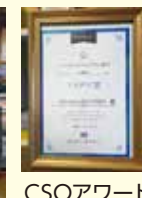
CSOアワード アイデア賞受賞