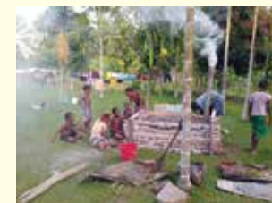
ニューギニア炭焼き実践